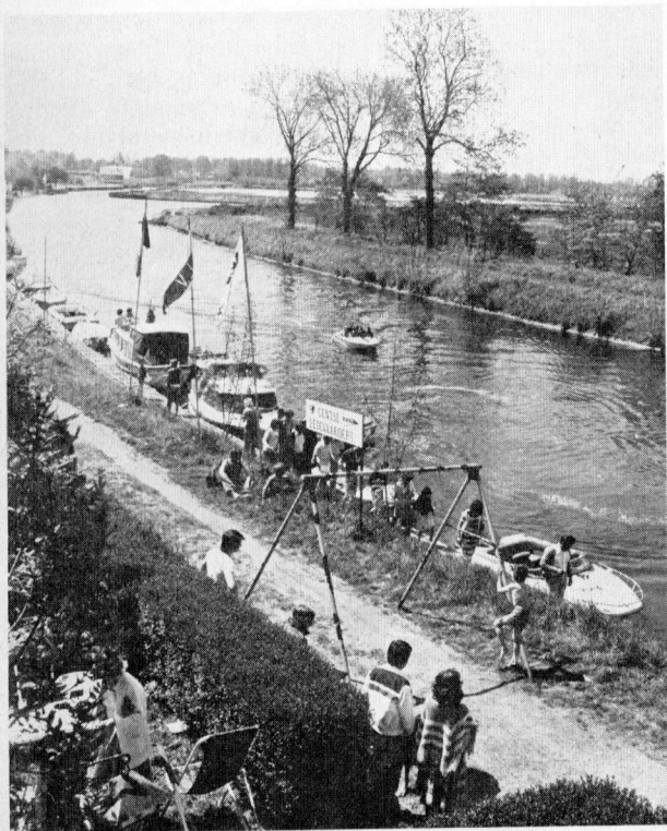
Une fête le long de la Lys.