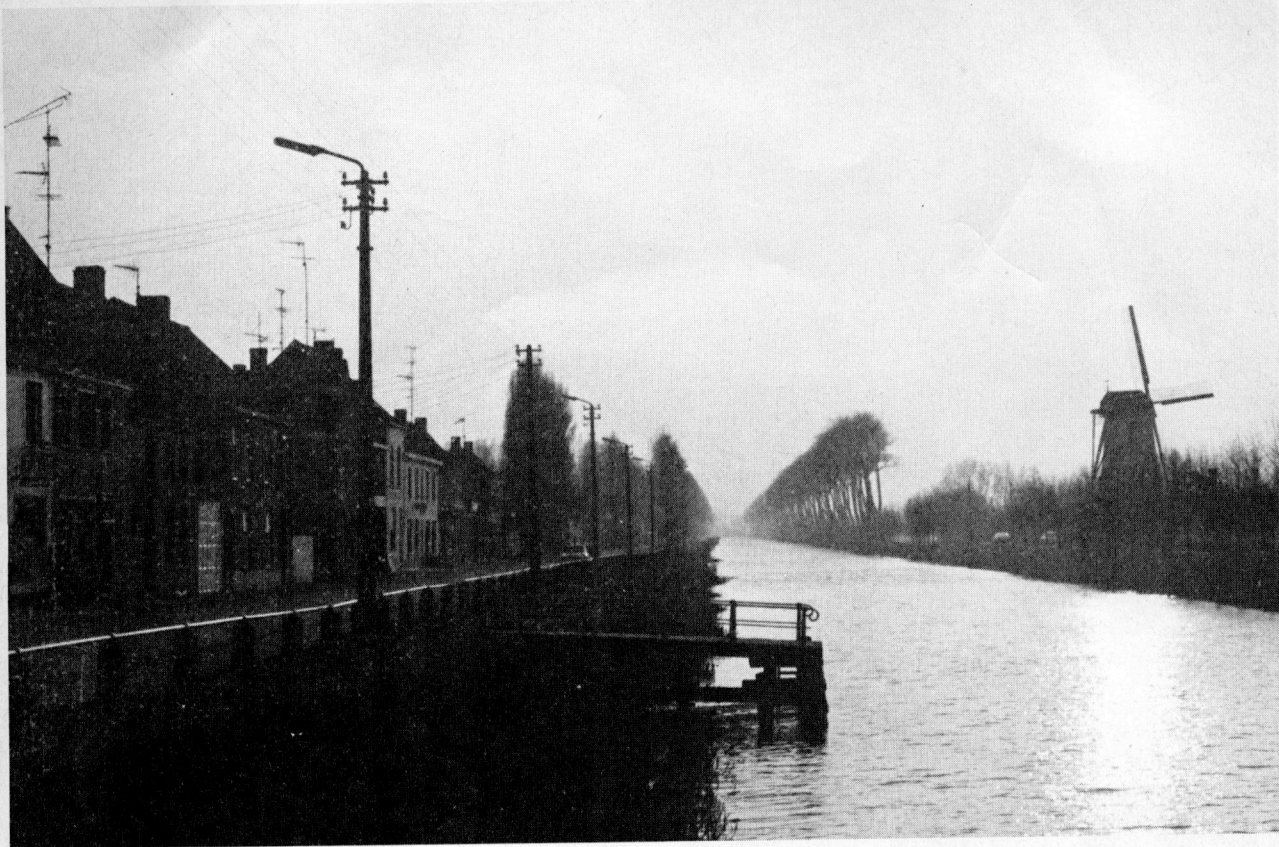
De Bruges à Damme, les regards dérapent jusqu'à l'horizon...